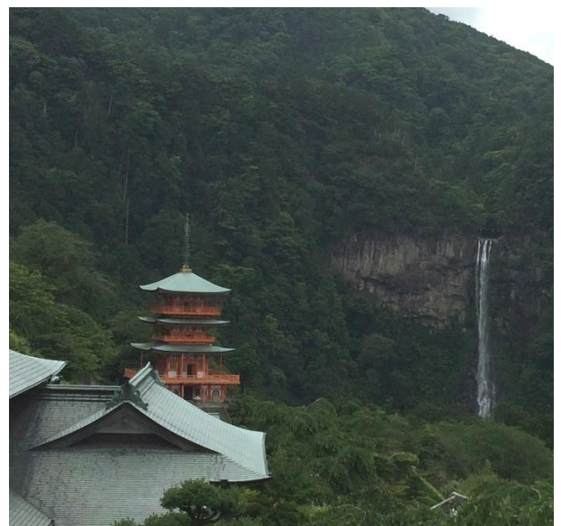
那智滝（和歌山県那智勝浦町）