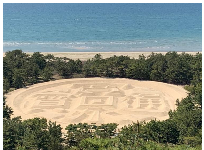
琴弾公園の銭形砂絵

ふーちゃん：それなら観音寺市の琴弾公園の銭形砂絵見るとお金に困らないらしいから行ってみてはどうですか。