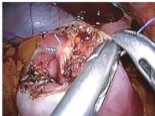
腹腔鏡下に切除後欠損部を縫合した