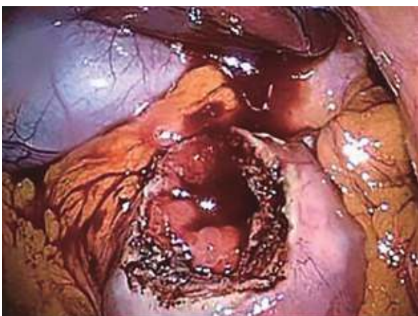
全層局所切除が完了した