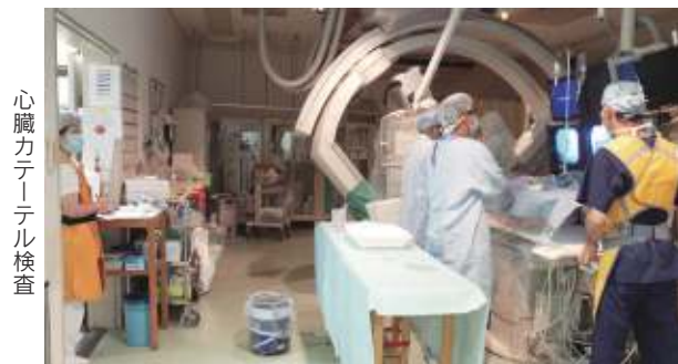
心臓カテーテル検査

【血管造影検査】 心臓血管カテーテル検査や心筋梗塞等の血管内治療、ペースメーカーの植え込み術などを行っています。