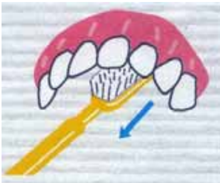
図 2. 上下の前歯の内側は、歯ブラシを縦に構えて磨きます。磨き残しに注意して！

図 1. 前歯の外側を磨く時は、歯ブラシを鉛筆のようにもって歯と歯ぐきのさかい目に毛先を当て軽く左右に動かします。横磨きを大きくしたり、力が入りすぎていると歯の付け根が削れてしまうので要注意！！前歯のすき間は歯ブラシを立てて磨きます。